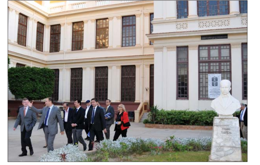
Ελληνισμός της Αιγύπτου».