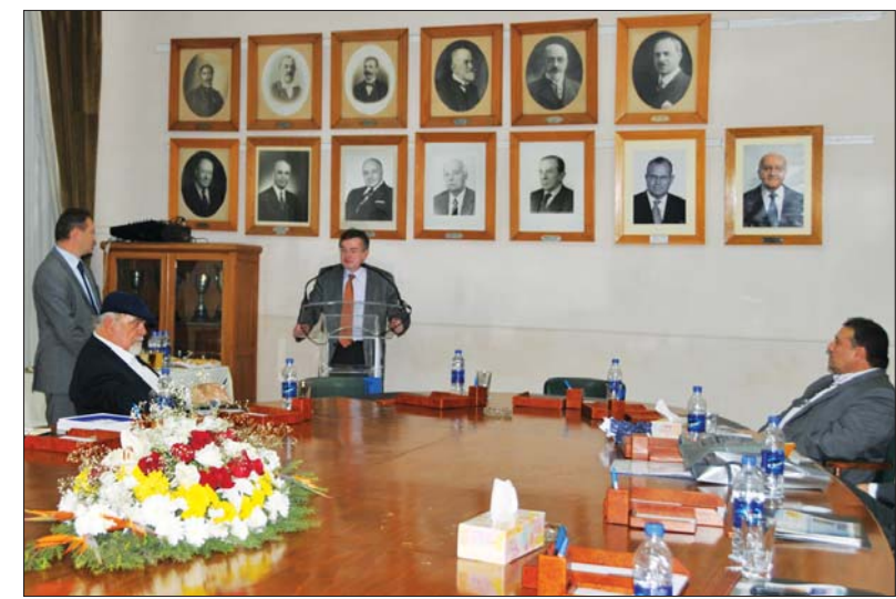
Η ΟΜΙΛΙΑ ΤΟΥ ΠΡΟΕΔΡΟΥ ΤΗΣ ΕΚΑ ΓΙΑΝΝΗ ΣΙΟΚΑ

Ο ΥΦΥΠΟΥΡΓΟΣ ΕΞΩΤΕΡΙΚΩΝ ΚΥΡΙΑΚΟΣ ΓΕΡΟΝΤΟΠΟΥΛΟΣ ΕΝΤΥΠΩΣΙΑΣΤΗΚΕ ΑΠΟ ΤΟ ΕΡΓΟ ΤΗΣ ΕΛΛΗΝΙΚΗΣ ΚΟΙΝΟΤΗΤΑΣ ΑΛΕΞΑΝΔΡΕΙΑΣ