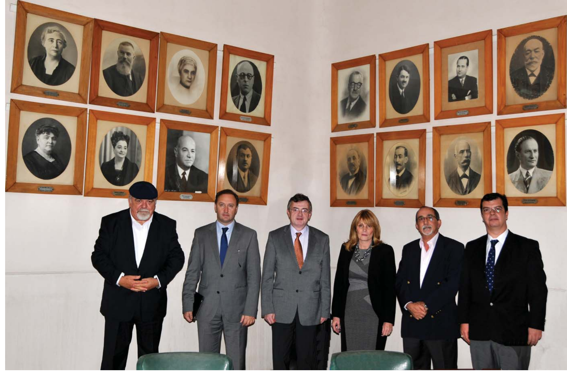
Θερμή υποδοχή επεφύλαξε στον Υφυπουργό Εξωτερικών κ. Κυριάκο Γεροντόπουλο, ο Πρόεδρος κ. Ιωάννης Σιώκας και η Κοινοτική Επιτροπή της ΕΚΑ.

Στο Μουσείο Καβάφη, τον Υφυπουργό Εξωτερικών υποδέχτηκε ο Διευθυντής του Παρτηματός